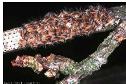
Chenilles de la processionnaire du chêne au 1er stade (Nageleisen L. DGAL / DSF)

Impact esthétique et santé de l'arbre (défoliation)