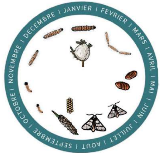
Cycle de la processionnaire du pin (Observatoire des EESH)

Lorsque la procession aura eu lieu, laisser le sac en place pendant quelques semaines. Puis équipez vous d'Equipements de Protection Individuelle (gants, combinaison, lunettes, masque) et retirez le sac pour éviter qu'il soit détérioré et libère des soies urticantes. Rincez les zones contaminées (tronc, collier) et rangez le matériel. Le collier peut être laissé en place. Le sac doit être fermé et peut être stocké en lieu sûr pour être réutilisé l'an prochain s'il n'a pas été endommagé (en portant des EPI lors de la manipulation).