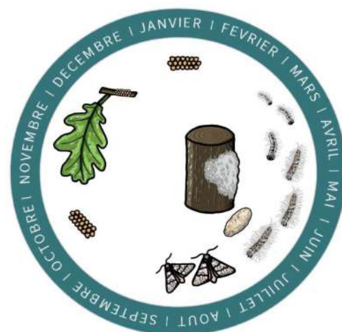
Cycle de la processionnaire du chêne (Observatoire EESH)

Impact sur la santé (pas de chenilles actuellement)