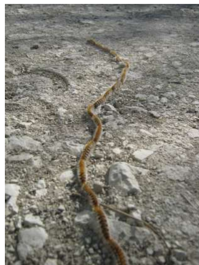
Procession de processionnaire du pin

Pour en savoir plus : https://chenille-risque.info/